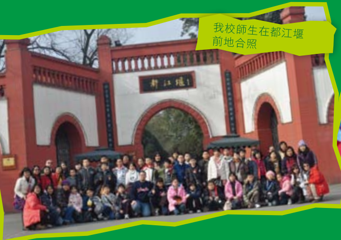
我校師生在都江堰前地合照