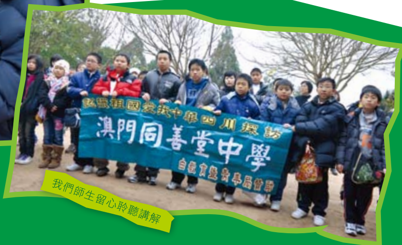
我們師生留心聆聽講解