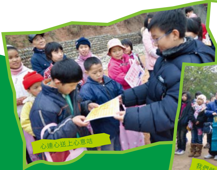
心連心送上心意咭