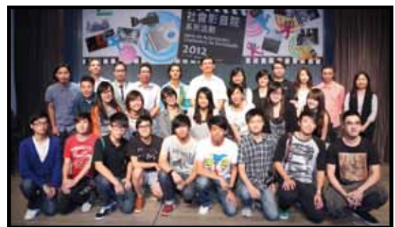
社會影音院系列活動合照

沒有明星，沒有厚厚的劇本，沒有專業拍攝器材，沒有專業的剪接設備，也不是專業的團隊，但有的是能打動人心靈的題材，社會的觸覺，把發生在你我身邊的人和事，運用智能手機、數碼相機拍攝下來。在家中進行剪接，再上載到網絡平台流傳。透過短短數分鐘的影片，引發人們關注社會，期望微電影能更有效地發揮感染力，把人們的訴求帶出，以改善社會。🌱