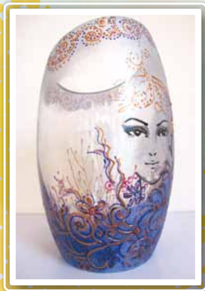
創作媒材：玻璃花瓶彩繪