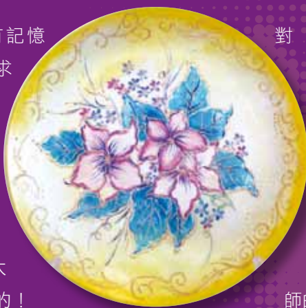
創作媒材：陶瓷彩繪

來到澳門，找不到做服裝設計的工作，我只好選擇了美術教師這一職業。從未想過自己會做一名教師，記得上第一節課的情景，四十分鐘面