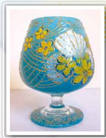
創作媒材：玻璃酒杯彩繪