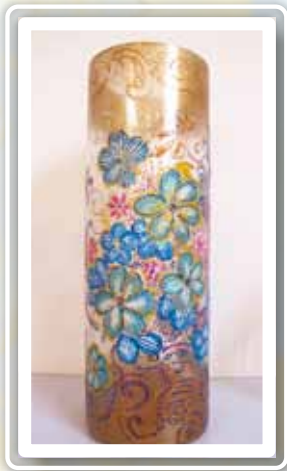
創作媒材：玻璃花瓶彩繪