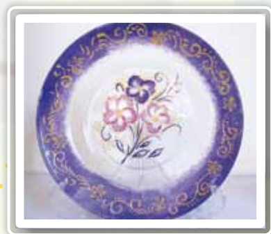
創作媒材：玻璃碟彩繪