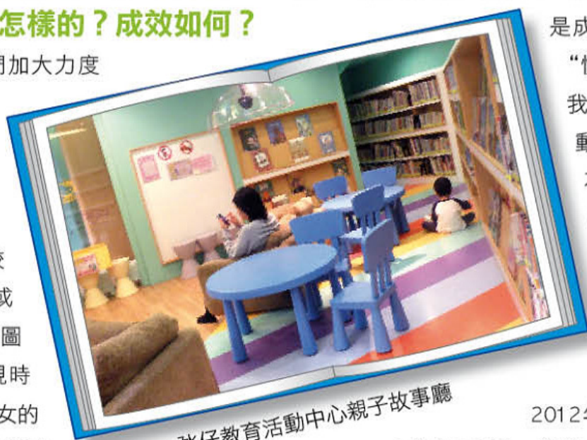
丞仔教育活動中心親子故事廳

時下家長因為輪班工作或下班時間較晚，導致和子女溝通的時間比較少，家長在書店或書展中購買大量的圖書給子女，可見現時的家長都頗重視子女的閱讀，但很多時忽略了一點，就是不會陪伴年幼子女一起閱讀，只提供書籍給他們，而自己陪伴子女的時間很短，任由他們自己翻閱書本，這樣的效果不大。在我們推廣親子共讀時要讓家長知道共讀的重要性，需要多些陪伴孩子，既可增進親子關係亦能讓孩子更了解書本內容的含義。在推廣親子共讀方面：一、我們邀請專家為家長做講座，透過講座讓家長認識親子共讀的重要性、方法和技巧。二、透過我們培訓的“讀書會帶領人種籽師資培訓課程”的導師所舉辦的活動中，帶一些訊息和方法給家長如何進行親子共讀。“讀書會帶領人種籽師資培訓課程”經歷了十年時間，已培訓了一批讀書會帶領人導師，中心會提供機會給他們舉辦一些讀書會活動。2013年本中心繼