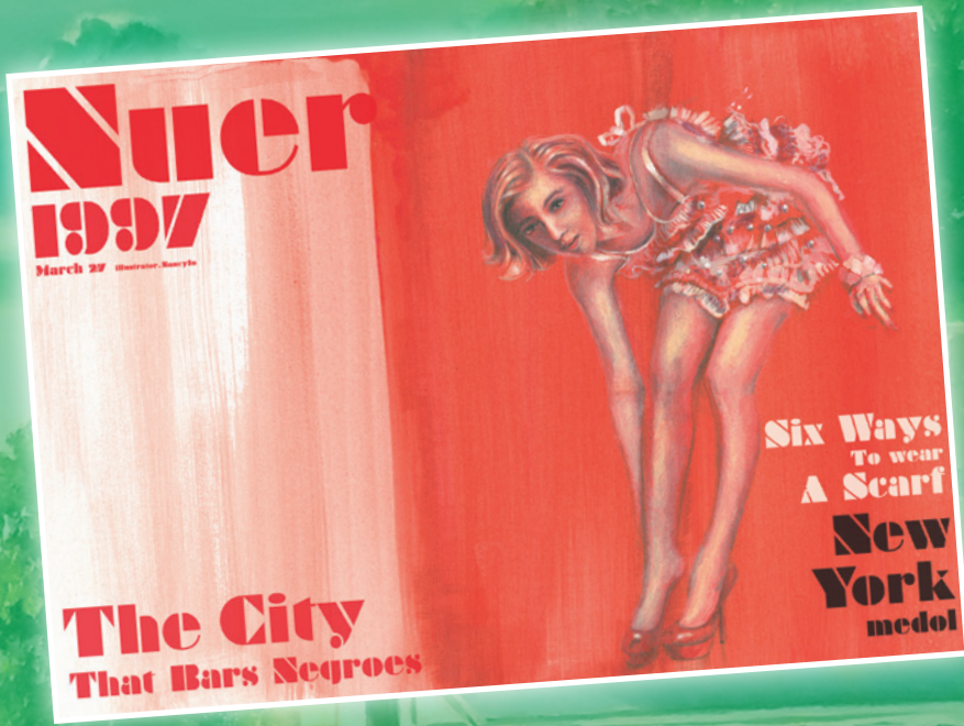
Nuer Magazine - 插畫