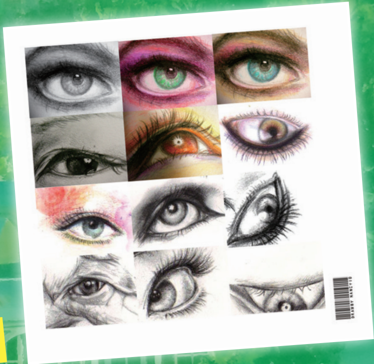
Eyes - 色彩素描