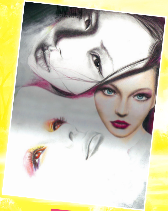
Faces - 色彩素描