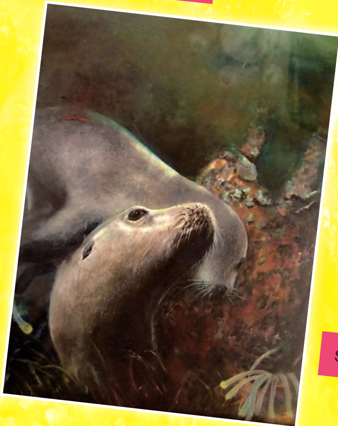
Save The Earth - 丙烯