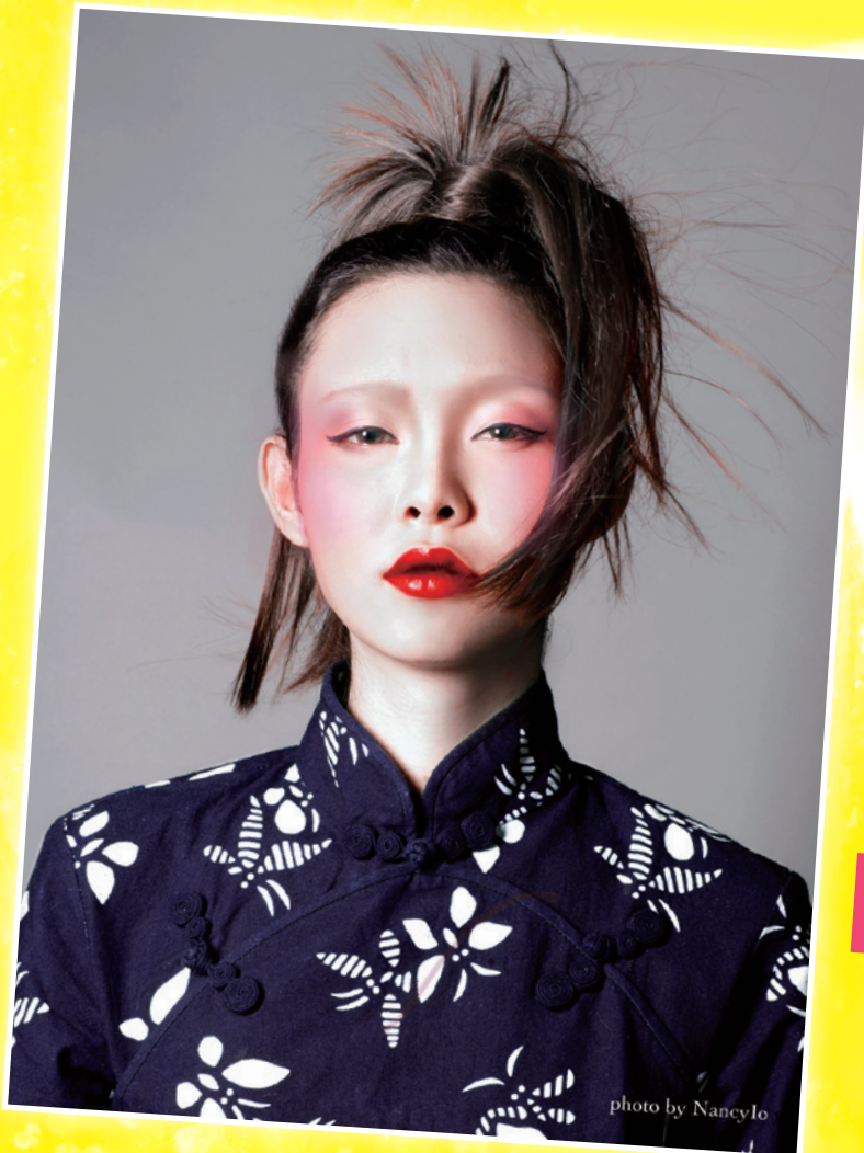
思索 - 攝影