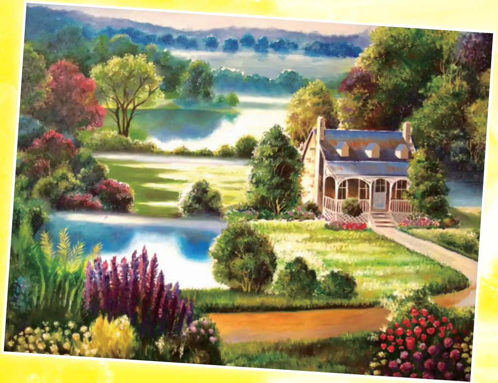
家 - 油畫