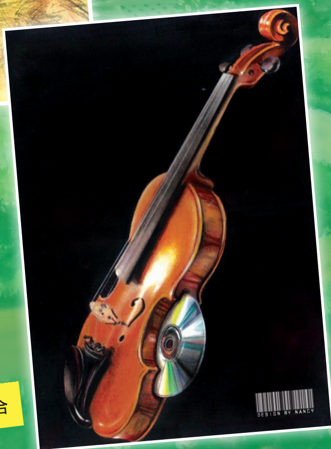
現代的小提琴 - 綜合