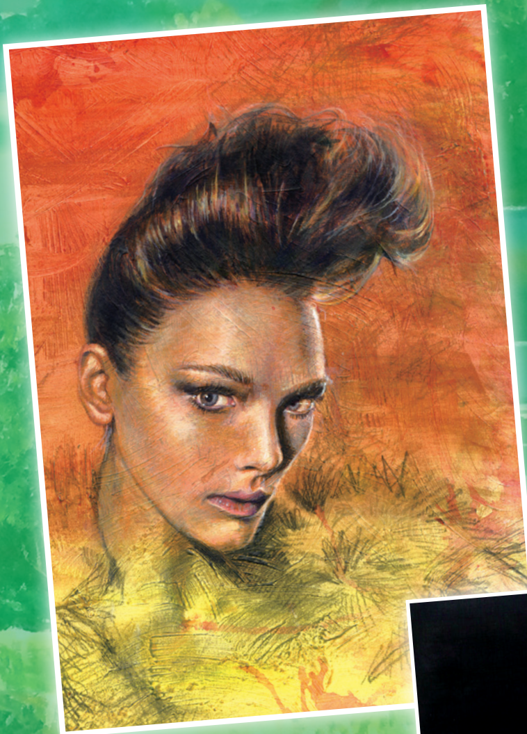
凝望 - 丙烯