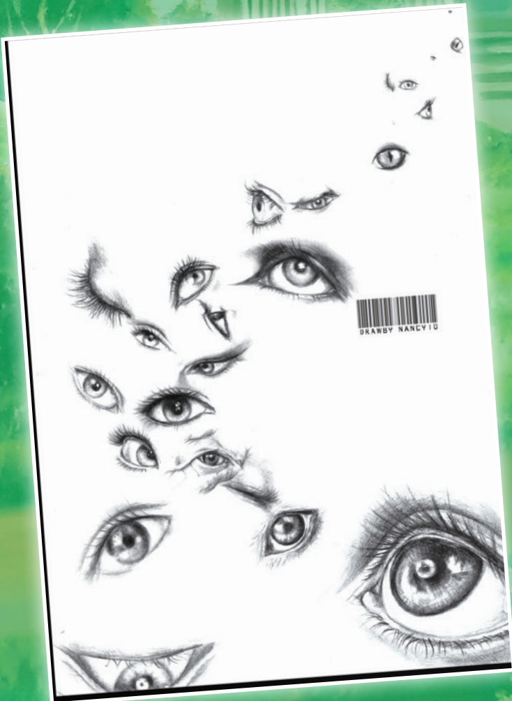
Your Eyes - 素描