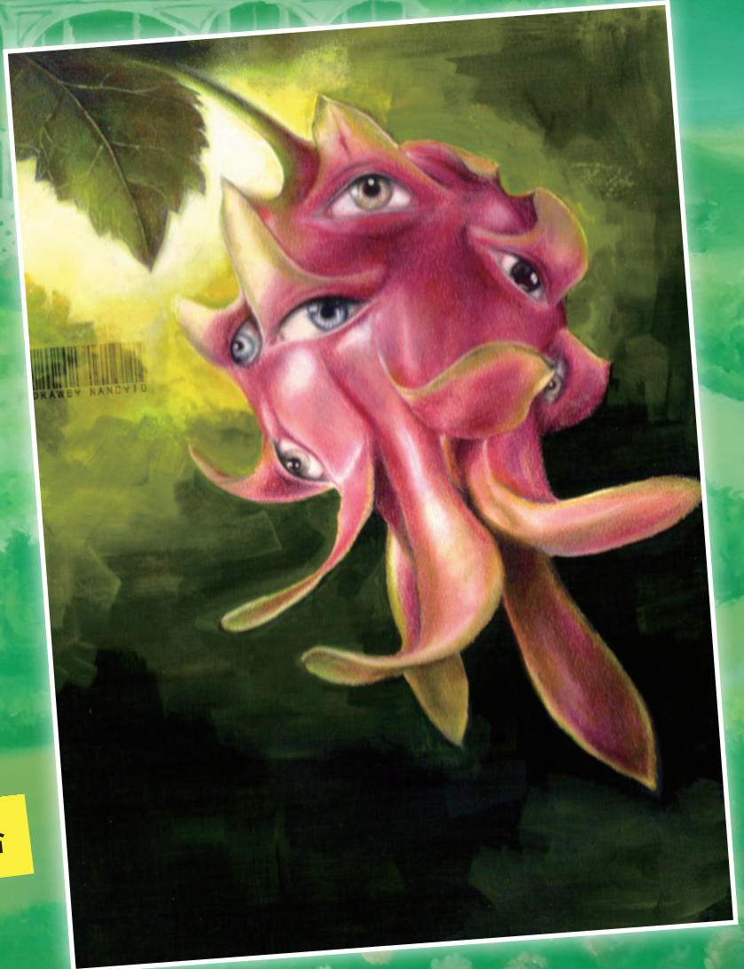
變種水果 - 綜合