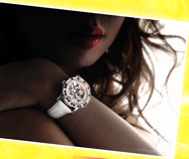
廣告設計 - 攝影