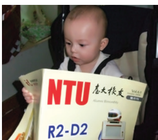
7個月大嬰兒的閱讀行為

舉例而言，當師長為幼兒挑選了一本圖畫書（繪本），朗讀圖畫書給幼兒聽時，幼兒通過聆聽，提高了對語音的敏感度，豐富了口語的詞彙。當師長帶領幼兒一起觀察、欣賞圖畫書中精心設計的圖片，引導幼兒說出自己看到的故事情節，並鼓勵幼兒觀察圖片中人物的造型、道具的安排、角色的互動、背景的颜色、單張圖片的布局與前後圖片間的關聯，幼兒就能通過閱讀圖畫，學習作者（繪圖者）的思維與創作技巧，進而掌握故事的主旨（作者想要讀者學到的道理）。當師長帶領幼兒一起朗讀書中的字句時，幼兒便能從中觀察漢語書面語的運用習慣。這些活動不但能激發幼兒獨立閱讀的動機，更能帶動幼兒運用口語、圖畫或符號向他人表達自己想法的創作行為（郝廣才，2006；黃娟娟，2006）。