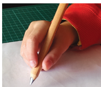
5歲幼兒使用較粗的三角形鉛筆畫字

當幼兒開始關注他人是否能讀出自己寫的字，同時期望自己能寫出標準字形時，教師就可以指導幼兒留意正確字形的筆畫與筆順（周碧香，2008）。此時，應該同時指導寫字時的坐姿與握筆的方式。由於幼兒的骨骼與小肌肉發展尚未成熟，為了協助幼兒以正確的握筆姿勢寫字，建議教師提供“較粗的、