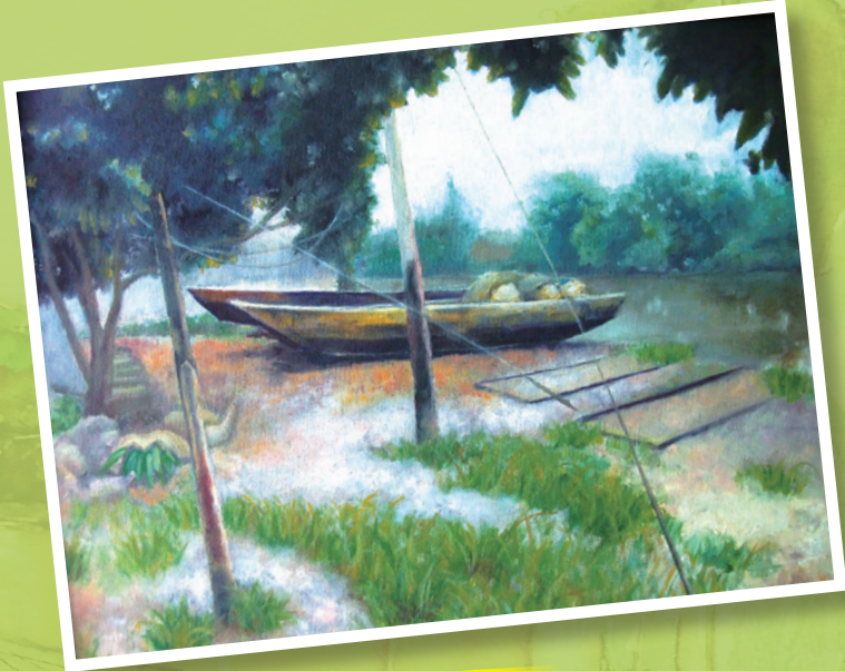
整裝待發 - 2011 - 油畫