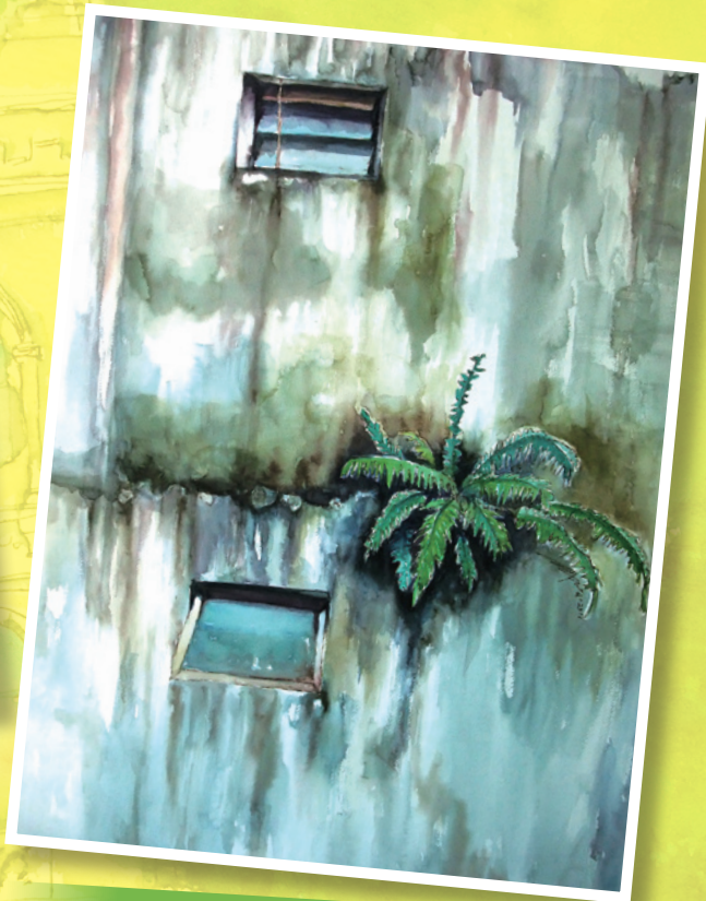
狹處逢生 - 2013 - 水彩紙本