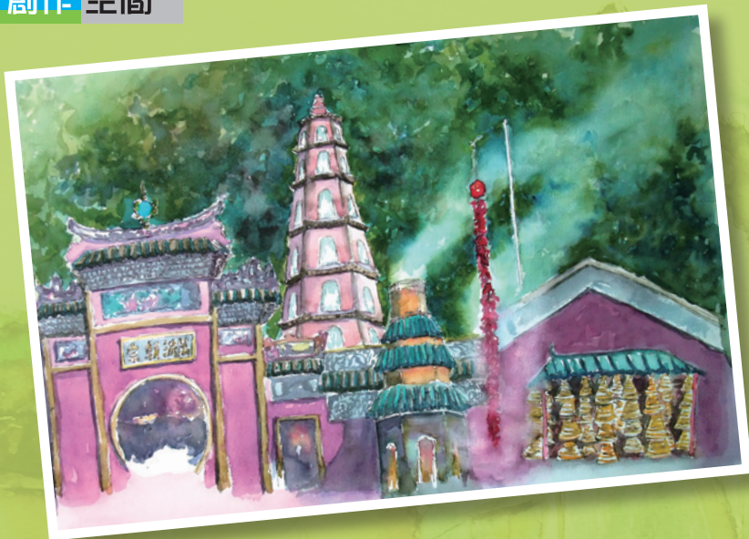
大年初三的媽閣 2013 - 水彩紙本