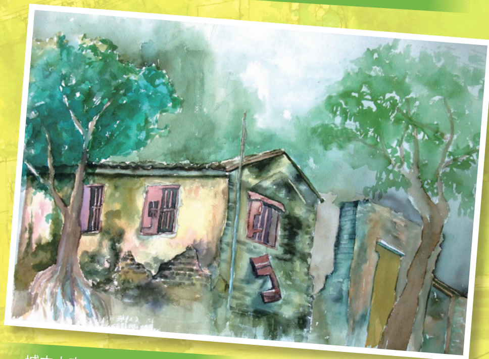
城中古宅 - 2012 - 水彩紙本