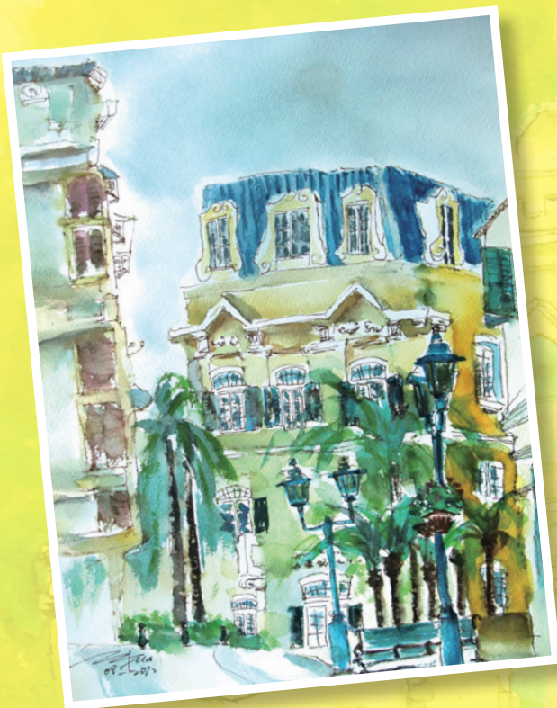
青翠一角 - 2012 - 水彩紙本