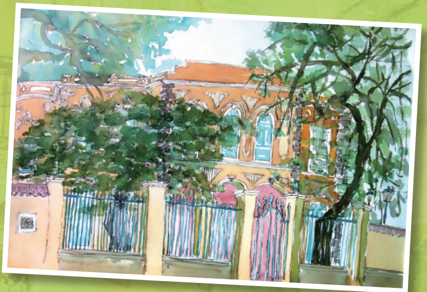
校門守衛 2013 - 水彩紙本