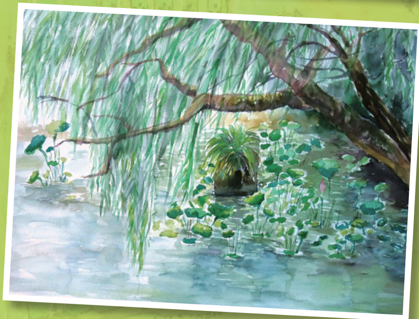
荷葉盛放 2013 - 水彩紙本