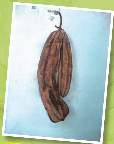
壁飾 - 2011 - 油畫