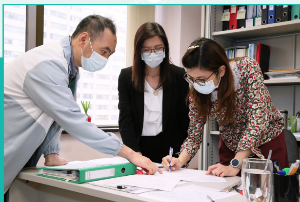
與上級及同事開會

自1月23日起，全澳所有口岸實施健康申報，需要大量的人手駐守八個口岸，指導和協助入境人士完成健康申報。當時，我協助我的上級、口岸衛生檢疫隊的主管在非常短的時間內迅速調配部門內的人手到各口岸應急，由於不少口岸是24小時運作的，故需要向其他部門請求支援。適逢農曆新年前夕，很多同事早已安排放假或其他新年節慶活動，但他們都明白應對疫情的迫切性，願意放棄團年飯、與親朋聚會等私人活動，立即報名參與防疫工作。